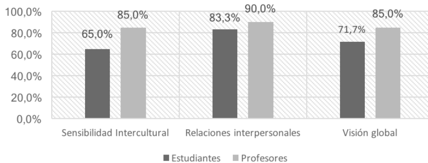
Figura 3. Porcentaje desarrollo de competencias interculturales

En los profesores encuestados se obtiene una calificación de buena en las tres dimensiones, resultados coherentes con el hecho de que todos han tenido experiencias de movilidad internacional.