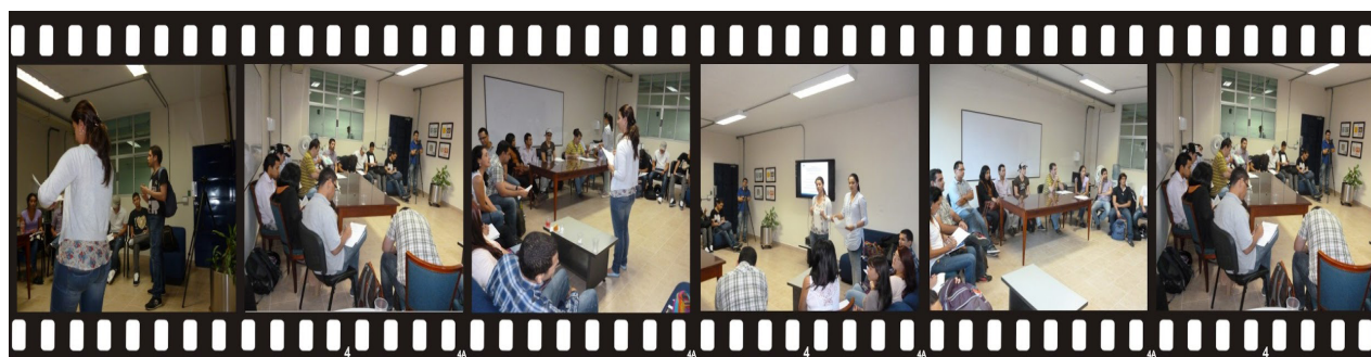
Figura 2. Ejecución Grupo Focal

En la Fase II de ejecución del GF, se siguió al pie de la letra el guion diseñado para la actividad, ejecutándose a cabalidad la sesión; se logró una buena sesión de trabajo, como se ilustra en la Figura 2, al generarse una interacción sinérgica entre los moderadores y los participantes. Cabe destacar que la logística funcionó sin ningún percance y que los invitados asistieron en su totalidad.