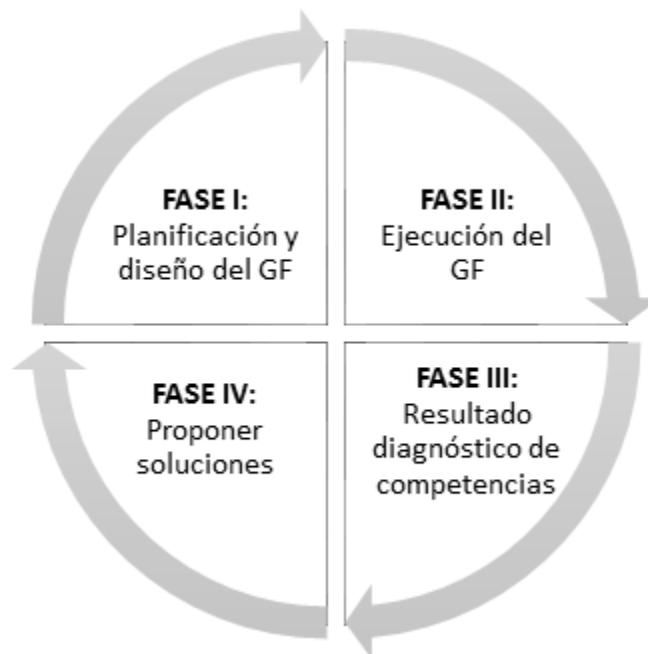
Figura 1. Metodología para el diseño y ejecución del GF como ciclo PHVA